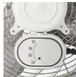
●強弱スイッチ(100V機種のみ)