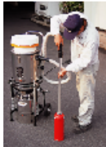
●パウダー薬剤吸引作業例