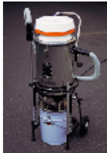
●別売ペール缶装着例

本体タンクは下部にバタフライ弁を装着していますので、吸引した薬剤は、開閉クリップを回すことにより、下側にセットした別売薬剤回収缶に落下させて極簡単に処理できます。 (汎用のペール缶も使用できます。)