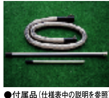
●付属品(仕様表中の説明を参照)