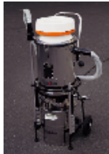
●別売専用缶装着例